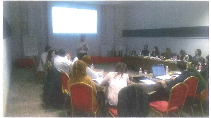
Atelier de formation sur les incertitudes, 31 mars et 1 er avril 2016

Par ailleurs, une session de formation a été organisée le 31 mars et 1 er avril 2016 au profit des membres du groupe « inventaire » pour mieux maîtriser les aspects liés aux méthodes d'évaluation des incertitudes selon les lignes directrices du GIEC et leurs applications pour l'inventaire tunisien des GES.