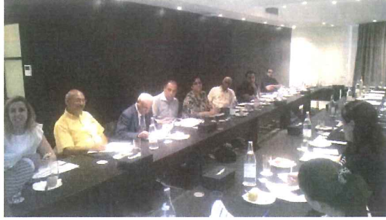
Atelier organisé au profit du focus group Média, le 03 octobre 2016

Il importe de noter que cet atelier marque le début d'un processus pour créer un noyau de journalistes spécialisés dans la thématique du changement climatique pour que dans un premier temps, appuyer la communication autour de la mise en œuvre de l'Accord de Paris et la participation tunisienne à la COP22, et favoriser, au-delà de celle-ci, une implication continue des médias tunisiens dans la sensibilisation et l'information sur le changement climatique et dans la couverture des événements qui s'y rapportent.