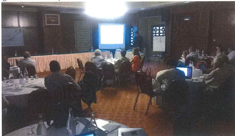
Atelier sur le rôle de la société civile dans la participation tunisienne à la COP2 – 27 juillet 2016

Relativement à l'organisation des « Focus Group », représentant les acteurs les plus importants et pertinents pour le sujet, quatre focus groups ont été identifiés : (i) institutions publiques, (ii) Secteur privé, (iii) Société Civile et (iv) Médias. Un dialogue a été initié avec chacun de ces groupes pour définir leurs rôles dans la participation à la COP22 et pour la mise en œuvre de l'accord de Paris. A cet effet, un atelier a été organisé le 27 juillet 2016, à Kairouan, réunissant des représentants de la société civile travaillant sur la thématique du changement climatique.